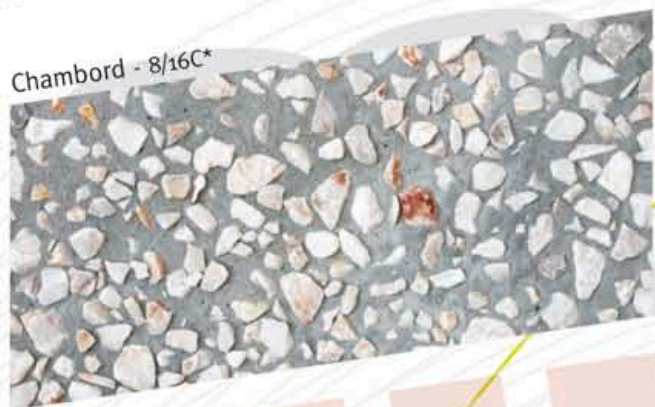
Chambord - 8/16C*