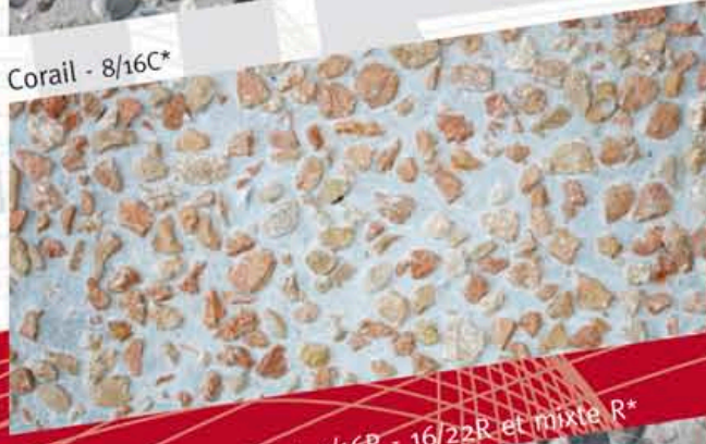
Corail - 8/16C*