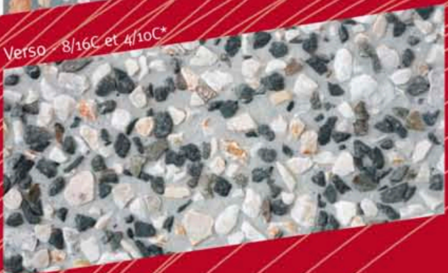
Verso - 8/16C et 4/10C*