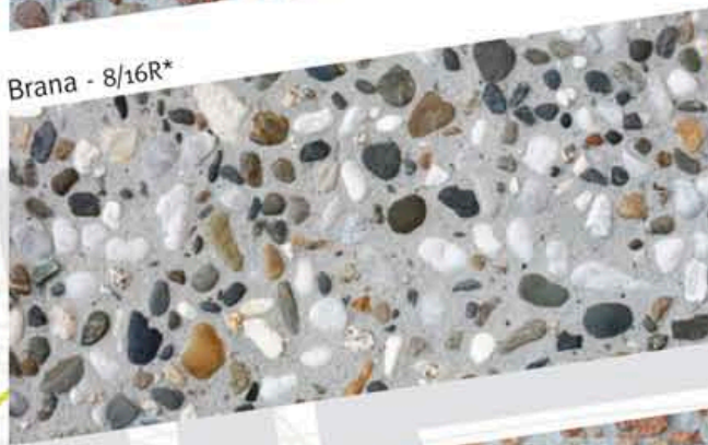
Brana - 8/16R*