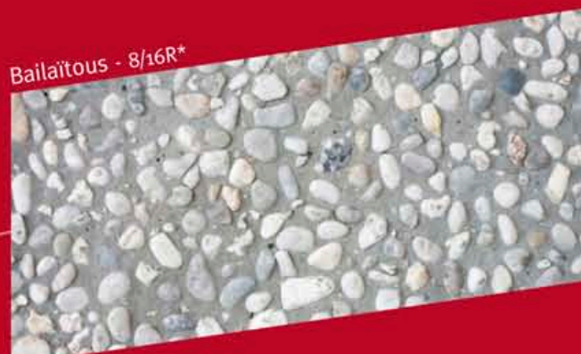
Bailaitous - 8/16R*