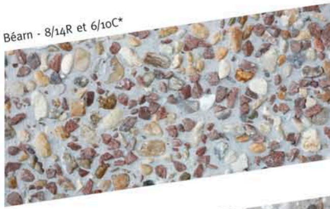
Béarn - 8/14R et 6/10C*