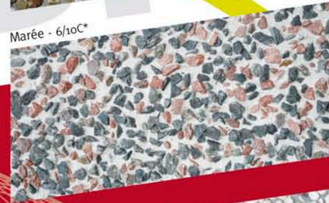
Marée - 6/10C*