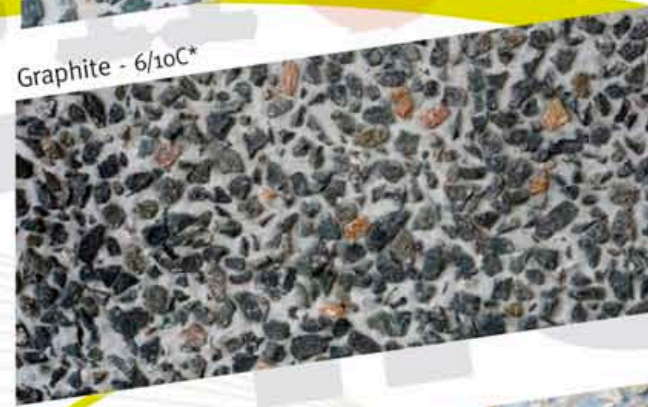
Graphite - 6/10C*