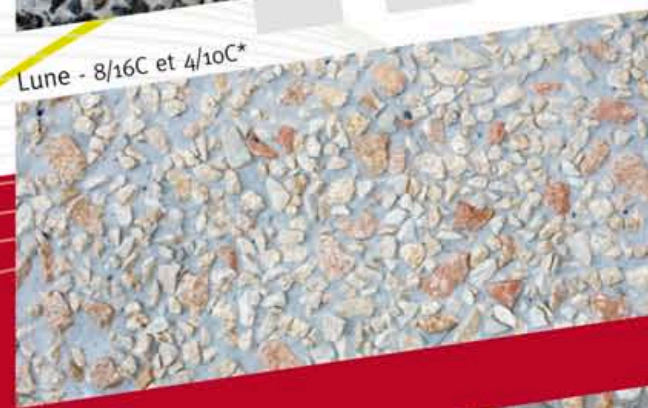
Lune - 8/16C et 4/10C*