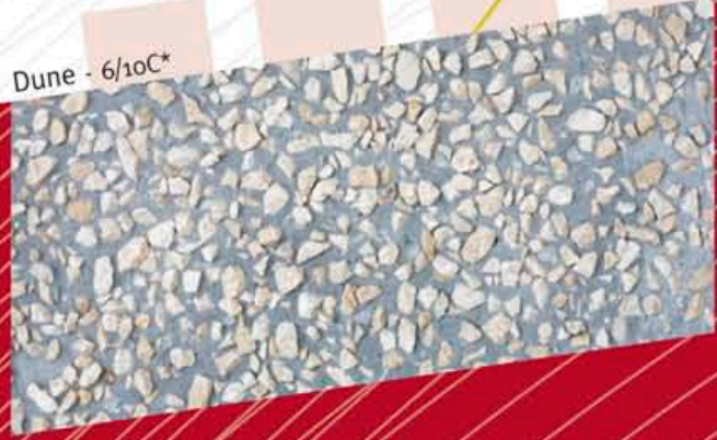
Dune - 6/10C*