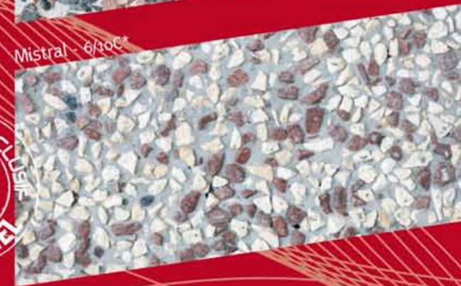
Mistral - 6/10C*