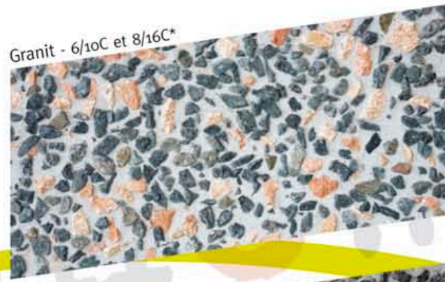
Granit - 6/10C et 8/16C*