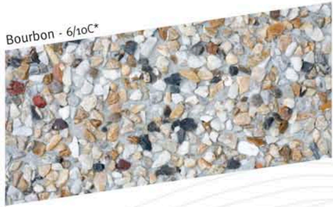
Bourbon - 6/10C*