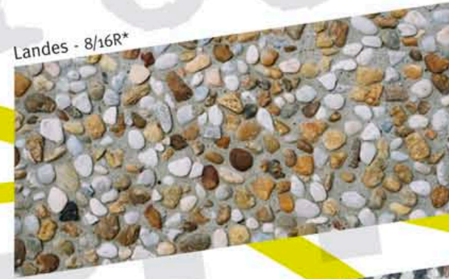
Landes - 8/16R*