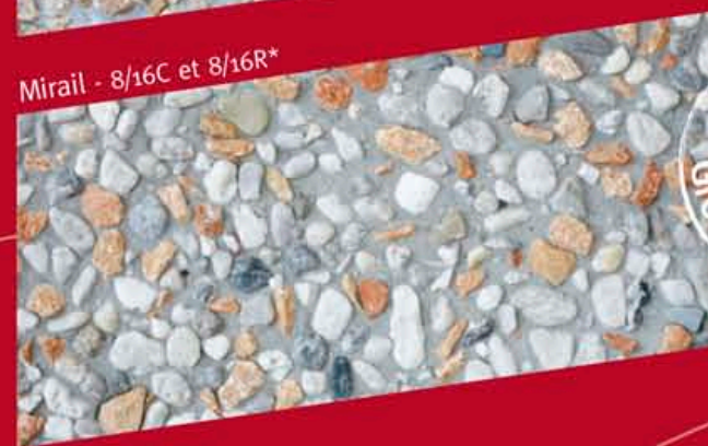
Mirail - 8/16C et 8/16R*